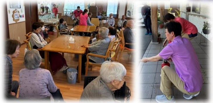
陽だまりの家と一緒に避難訓練・消火活動をしました