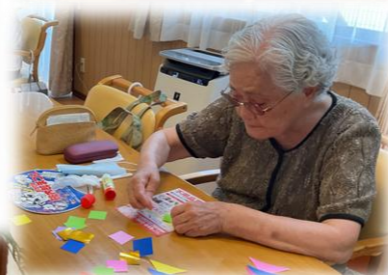
作業療法士による体操・ボタニカルペイント