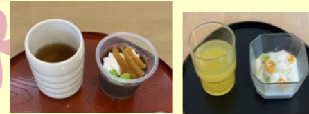
干し芋 フルーツ 水ようかん ヨーグルト 手作りおやつ

暑さが厳しくなるこれからの季節も水分補給や室温管理も行いながら、皆様が安心して笑顔で過ごせるよう努めて参ります。夏ならではの楽しみも取り入れながら、思い出に残る毎日と一緒に過ごして行きたいと思います。