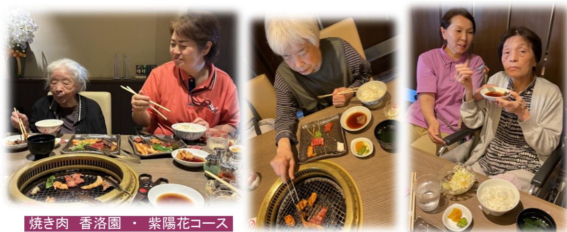
焼き肉 香洛園・紫陽花コース