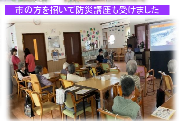
市の方を招いて防災講座も受けました