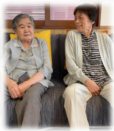
お誕生日おめでとう