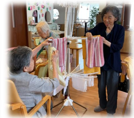
洗濯干しのお手伝い