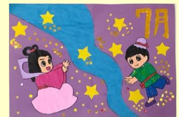
製作: 玄関カレンダー