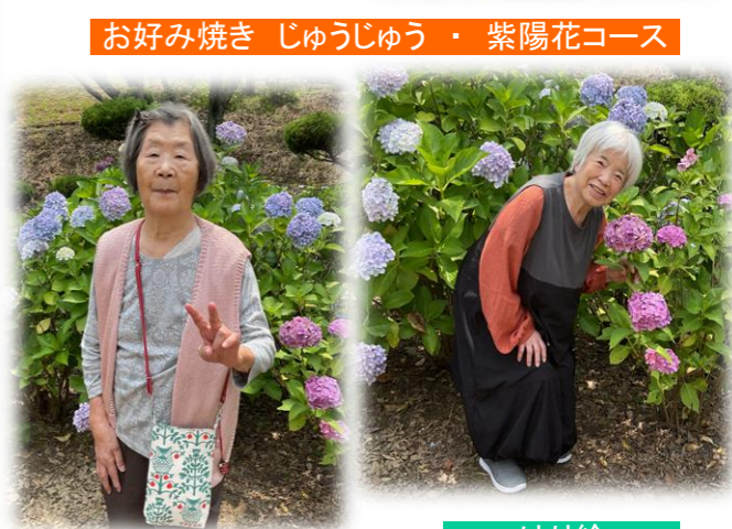
お好み焼き じゅうじゅう・紫陽花コース