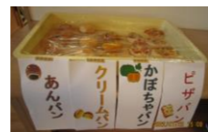
大好評 栄養士さんによる手作りパン