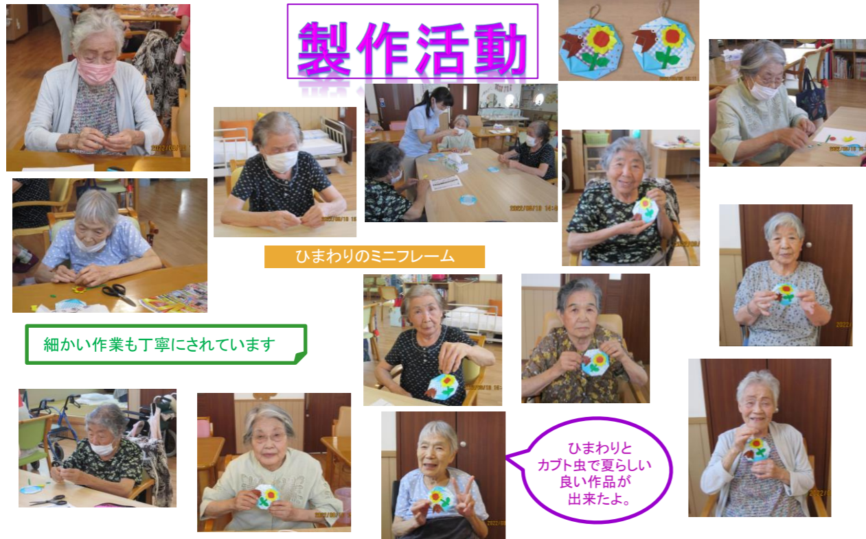
ひまわりのミニフレーム