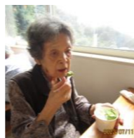
暑い時のアイスは格別です