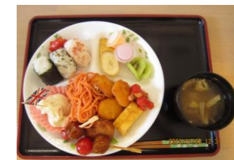
(懐かしの運動会弁当) おにぎり・卵焼・ウィンナー・スパゲティ ポテトサラダ・クリームコロッケ・ミートボール 彩りプチトマト・フルーツ・ゼリー等々