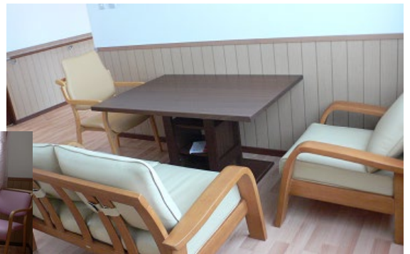
ゆっくりできる談話スペース