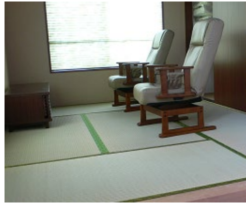
くつろぎの畳スペース