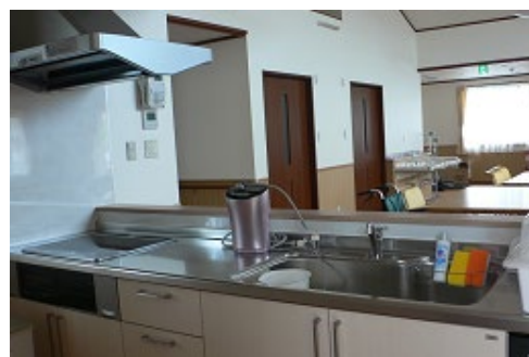
広い調理スペース