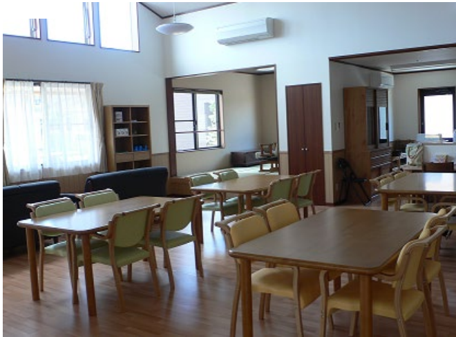
太陽の光あふれるフロアー