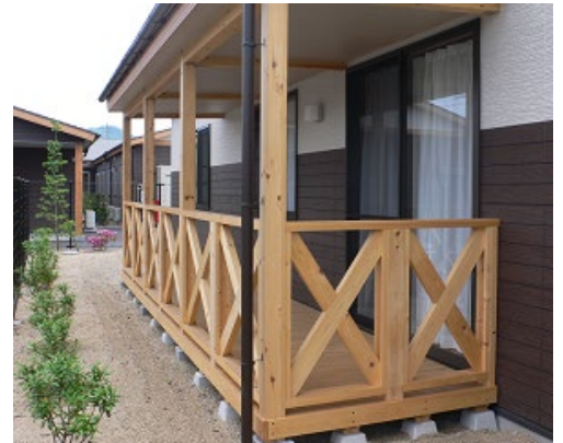
気持ちの良いウッドデッキ