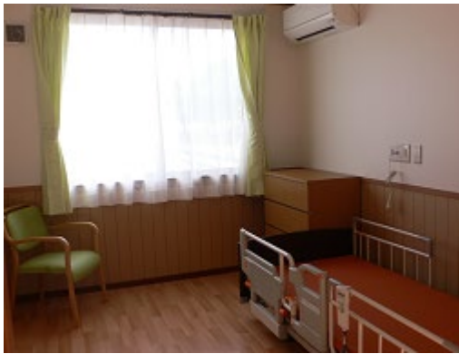
安心して泊まれる個室